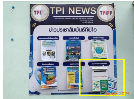
รูปที่ 2-45 เจ้าหน้าที่ลงพื้นที่รับข้อร้องเรียน และจัดทำกล่องรับเรื่องร้องเรียน