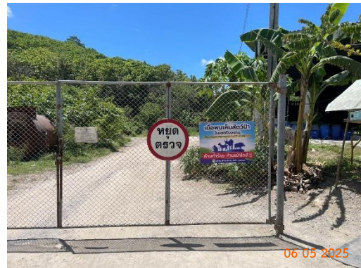
รูปที่ 2-44 ป้ายประชาสัมพันธ์ช่องทางแจ้งเหตุการณ์พบเห็นสัตว์ป่า