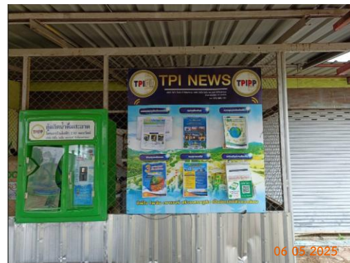
วัดท่าเสา หมู่ 13 ต.มวกเหล็ก วัดท่าเสา