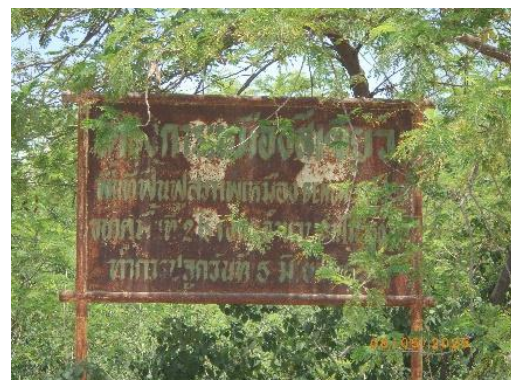
รูปที่ 2-41 การฟื้นฟูพื้นที่ที่ผ่านการทำเหมือง