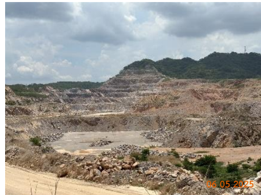
รูปที่ 2-25 ลักษณะการทำเหมืองแบบขั้นบันได