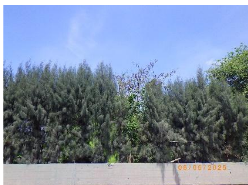
รูปที่ 2-42 ไม้ยืนต้นขนาดใหญ่ บริเวณขอบเขตพื้นที่โครงการที่ต่อเนื่องกับ โรงเรียนบ้านซับบอน