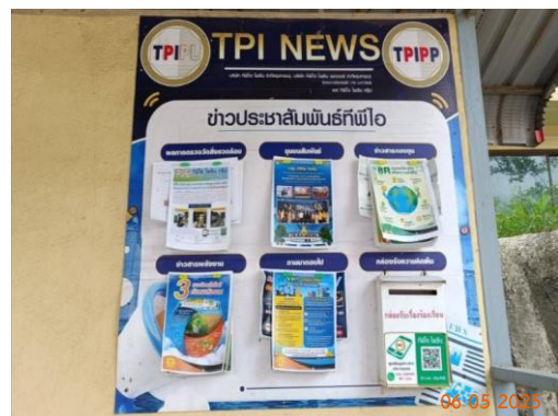
บ้านผู้ใหญ่ หมู่ 5 ต.มวกเหล็ก วัดหินลับ