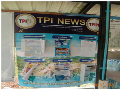
บ้านผู้ใหญ่ หมู่ 12 ต.มวกเหล็ก ที่ทำการผู้ใหญ่บ้าน ม.12

โครงการเหมืองแร่หินอุตสาหกรรมชนิดหินปูน เพื่ออุตสาหกรรมปูนซีเมนต์ สำหรับแปลงคำขอประทานบัตรที่ 12/2556 ร่วมแผนผังโครงการทำเหมืองเดียวกัน กับคำขอประทานบัตรที่ 13/2556, คำขอประทานบัตรที่ 14/2556, คำขอประทานบัตรที่ 15/2556, คำขอประทานบัตรที่ 16/2556 และคำขอประทานบัตรที่ 17/2556 และประทานบัตรที่ 27340/14390 ประทานบัตรที่ 27341/14391 และประทานบัตรที่ 27348/14392 ของบริษัท ทีพีโอ โพลีน จำกัด (มหาชน) ระหว่างเดือนมกราคม-มิถุนายน พ.ศ. 2568