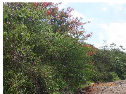
รูปที่ 2-6 การปลูกต้นไม้ทรงสูงตามแนวเส้นทางขนส่งแร่ บริเวณพื้นที่โครงการ