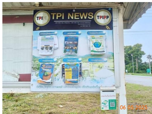
สายตรวจทับกวาง หมู่ 9 ต.ทับกวาง สายตรวจทับกวาง