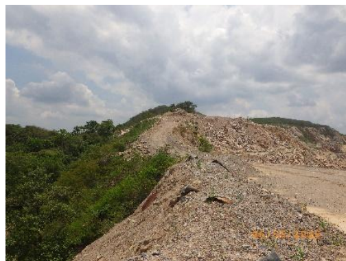
รูปที่ 2-28 เขตพื้นที่กันชน (Buffer zone)