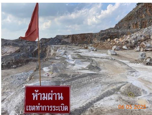
รูปที่ 2-22 ควบคุมระยะรยะรเบิดหน้าเหมือง (Burden Distance)