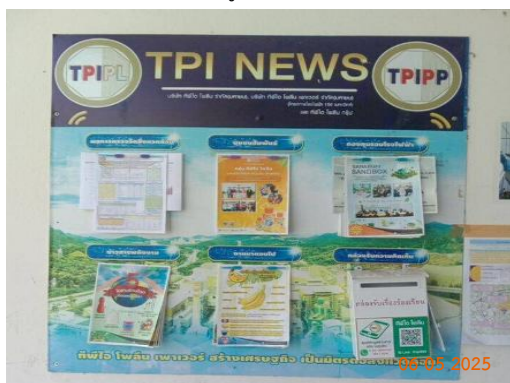
ศาลาประชาคม หมู่ 4 ต.มิตรภาพ