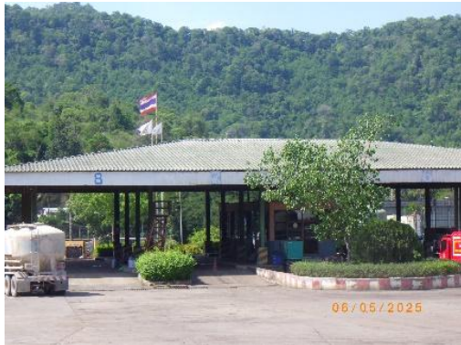
รูปที่ 2-18 เครื่องชั่งน้ำหนักบริเวณประตูที่ 3

โครงการเหมืองแร่หินอุตสาหกรรมชนิดหินปูน เพื่ออุตสาหกรรมปูนซีเมนต์ สำหรับแปลงคำขอประทานบัตรที่ 12/2556 ร่วมแผนผังโครงการทำเหมืองเดียวกันกับคำขอประทานบัตรที่ 13/2556, คำขอประทานบัตรที่ 14/2556, คำขอประทานบัตรที่ 15/2556, คำขอประทานบัตรที่ 16/2556 และคำขอประทานบัตรที่ 17/2556 และประทานบัตรที่ 27340/14390 ประทานบัตรที่ 27341/14391 และประทานบัตรที่ 27348/14392 ของบริษัท ทีพีโอ โพลีน จำกัด (มหาชน) ระหว่างเดือนมกราคม-มิถุนายน พ.ศ. 2568