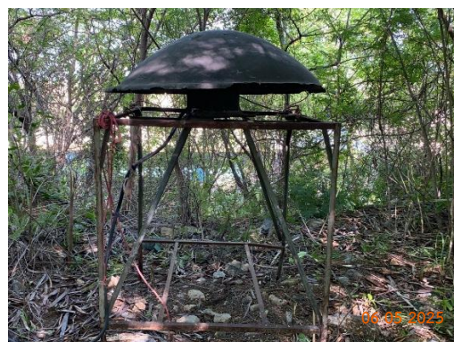
รูปที่ 2-23 หวอสัญญาณเตือน