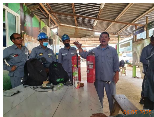
รูปที่ 2-35 การอบรมแก่พนักงานและผู้ควบคุม การดำเนินงาน ในเรื่องอาชีวอนามัยและความปลอดภัย