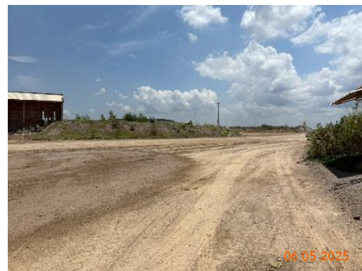
รูปที่ 2-15 ใช้ประโยชน์มูลดินในการปรับปรุงไหล่ทาง และเส้นทางบริเวณหน้าเหมือง