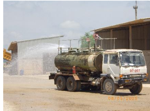
รูปที่ 2-8 การฉีดพรมน้ำ บริเวณพื้นที่โครงการ