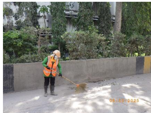
รูปที่ 2-21 พนักงานประจำเพื่อทำความสะอาดลานซีเมนต์ บริเวณโรงงานปูนซีเมนต์