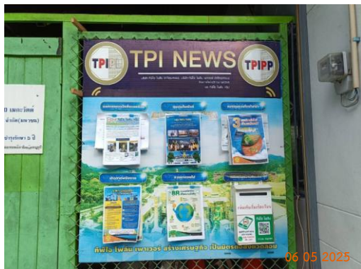
ศาลาประชาคม หมู่ 10 ต.มิตรภาพ

ของบริษัท ทีพีโอ โพลีน จำกัด (มหาชน) ระหว่างเดือนมกราคม-มิถุนายน พ.ศ. 2568