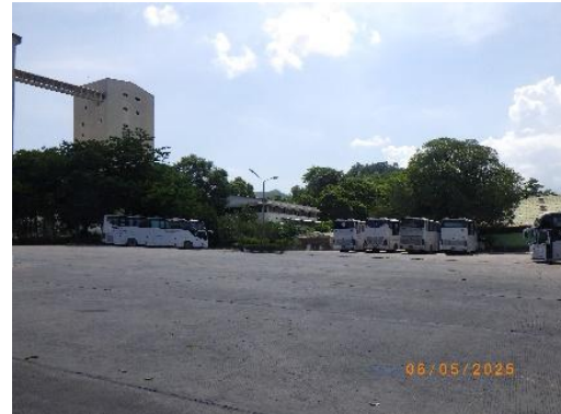
รูปที่ 2-19 ลานคอนกรีตเสริมเหล็ก บริเวณโรงงานปูนซีเมนต์และลานจอดรถบรรทุก