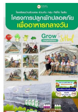
รูปที่ 2-43 สนับสนุนกิจกรรมการปลูกผัก ปลูกต้นไม้ และบำรุงรักษาต้นไม้ภายใน บริเวณโรงเรียนบ้านซับบอน