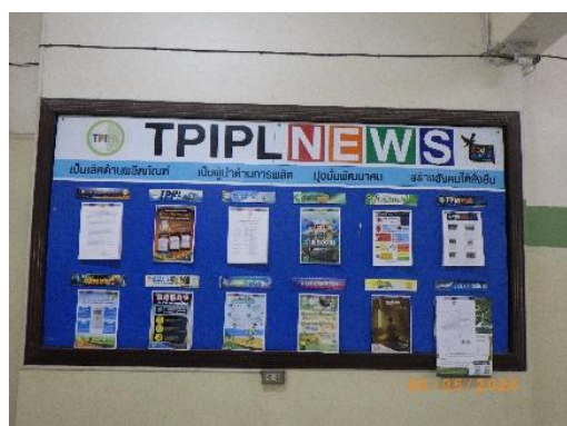
รูปที่ 2-34 บอร์ดประชาสัมพันธ์ แสดงเกี่ยวกับข้อมูลโครงการ