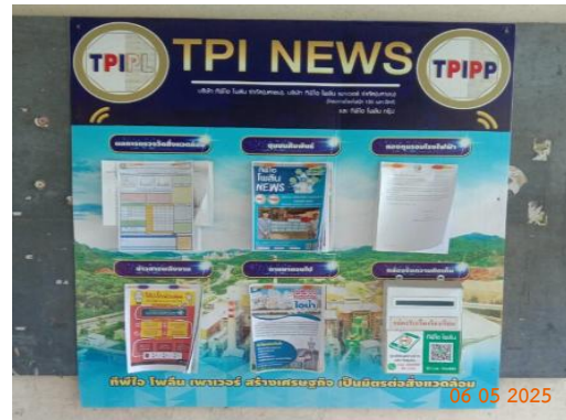
วัดชัยบอน หมู่ 5 ต.ทับกวาง ศาลาชุมชนบ้านชัยบอน