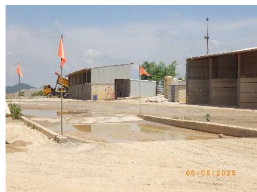
รูปที่ 2-17 บริเวณสำหรับการทำความสะอาดเศษดินเศษโคลนที่ติดตามรถบรรทุกแร่