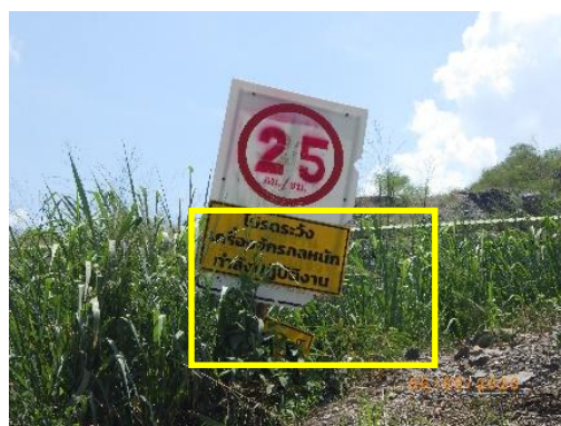
รูปที่ 2-32 ป้ายสัญญาณเตือนภัย บริเวณพื้นที่โครงการ