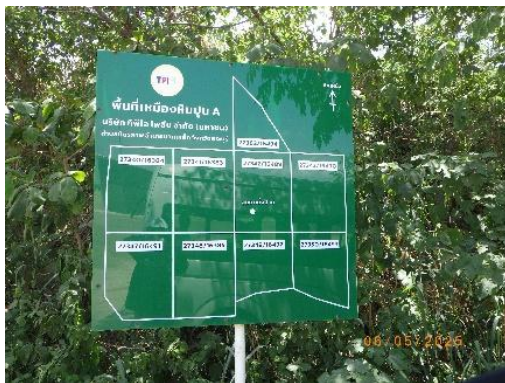
รูปที่ 2-3 ป้ายแสดงแผนผังพื้นที่โครงการ