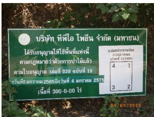
รูปที่ 2-5 ป้ายแสดงรายละเอียดของแปลงประทานบัตรบริเวณพื้นที่โครงการ