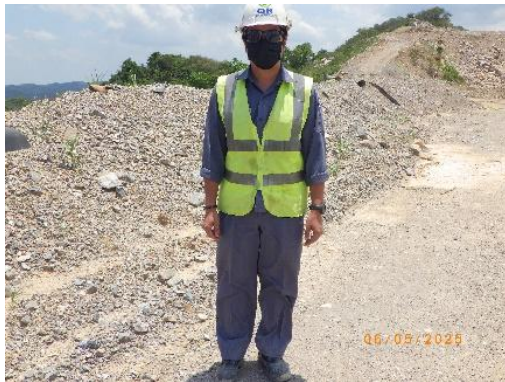
รูปที่ 2-12 การสวมใส่อุปกรณ์ป้องกันอันตรายส่วนบุคคลของพนักงาน

โครงการเหมืองแร่หินอุตสาหกรรมชนิดหินปูน เพื่ออุตสาหกรรมปูนซีเมนต์ สำหรับแปลงคำขอประทานบัตรที่ 12/2556 ร่วมแผนผังโครงการทำเหมืองเดียวกัน กับคำขอประทานบัตรที่ 13/2556, คำขอประทานบัตรที่ 14/2556, คำขอประทานบัตรที่ 15/2556, คำขอประทานบัตรที่ 16/2556 และคำขอประทานบัตรที่ 17/2556 และประทานบัตรที่ 27340/14390 ประทานบัตรที่ 27341/14391 และประทานบัตรที่ 27348/14392 ของบริษัท ทีพีโอ โพลีน จำกัด (มหาชน) ระหว่างเดือนมกราคม-มิถุนายน พ.ศ. 2568