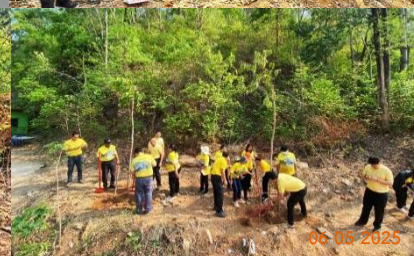
โครงการอนุรักษ์ และดูแลสิ่งแวดล้อมป่าชุมชนบ้านซับบอน