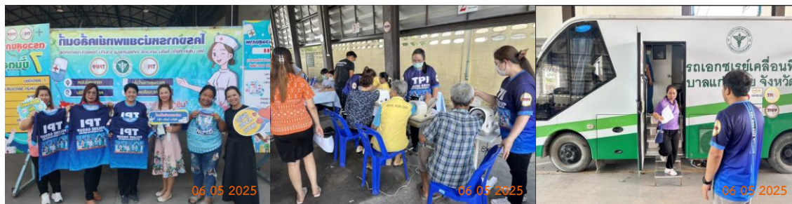
รูปที่ 2-36 การออกหน่วยแพทย์เคลื่อนที่ และการตรวจสอบสุขภาพ

ของบริษัท ทีพีโอ โพลีน จำกัด (มหาชน) ระหว่างเดือนมกราคม-มิถุนายน พ.ศ. 2568