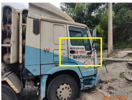
รูปที่ 2-31 เบอร์โทรศัพท์ หรือรายละเอียดที่สามารถ แจ้งข้อร้องเรียนที่เห็นชัดเจน ข้างรถบรรทุกแร่ของ โครงการ