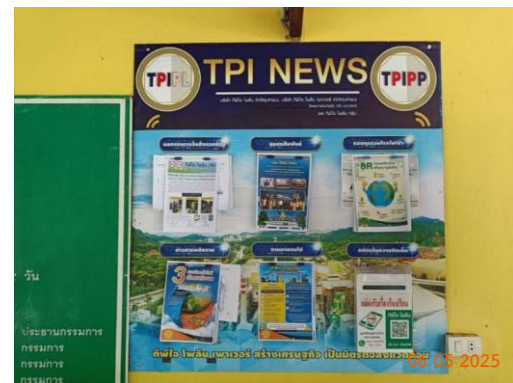
บ้านผู้ใหญ่ หมู่ 10 ต.ทับกวาง ที่ทำการผู้ใหญ่บ้าน ม.10