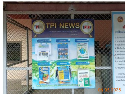
ศาลาประชาคม หมู่ 2 ต.ท่าคล้อ