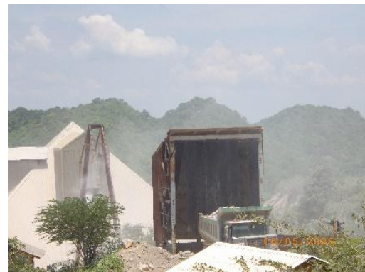
รูปที่ 2-10 เครื่องย่อยหินปูน (Limestone Crusher)