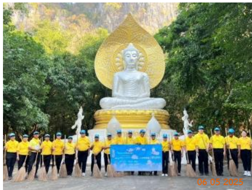
กิจกรรมจิตอาสาพระราชทานอำเภอแก่งคอย ณ วัดถ้ำพระโพธิสัตว์