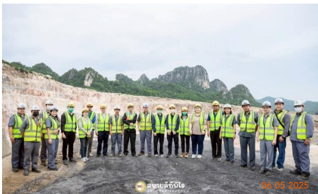
รูปที่ 2-46 การเข้าศึกษาดูงานในพื้นที่ของโครงการ