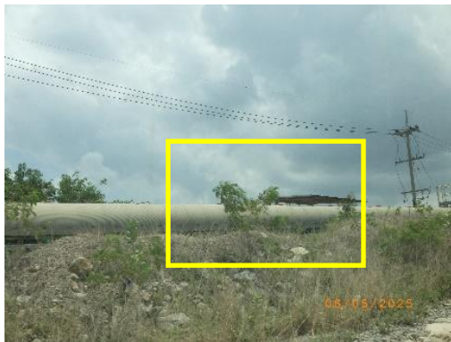
รูปที่ 2-9 โรงย่อยหินแบบ Semi Mobile Crusher