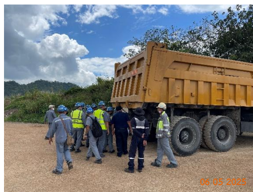
รูปที่ 2-30 การจัดอบรมพนักงานขับรถบรรทุกแร่