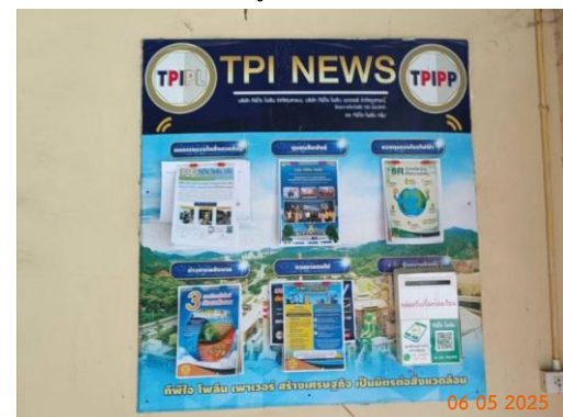
วัดชัยประดู่ หมู่ 6 ต.มวกเหล็ก วัดชัยประดู่