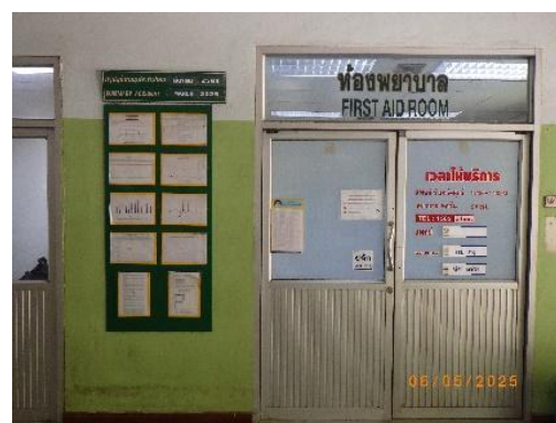
รูปที่ 2-37 ห้องพยาบาลและรถพยาบาลฉุกเฉิน