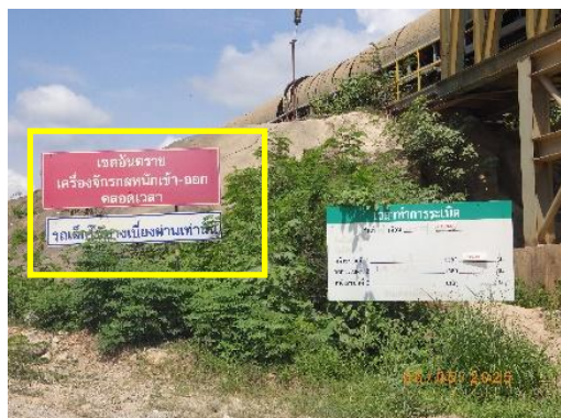
รูปที่ 2-40 ป้ายแสดงห้ามมิให้บุคคลภายนอก ที่ไม่มีหน้าที่เกี่ยวข้องเข้ามา