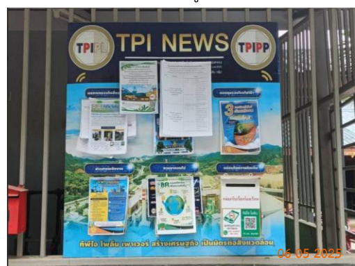
ศาลาประชาคม หมู่ 6 ต.มิตรภาพ