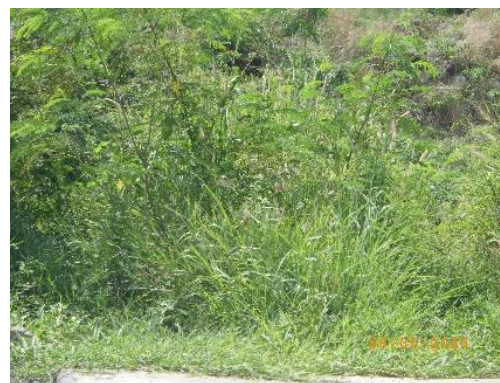
รูปที่ 2-38 ปักพืชคลุมดินบริเวณพื้นที่โครงการ