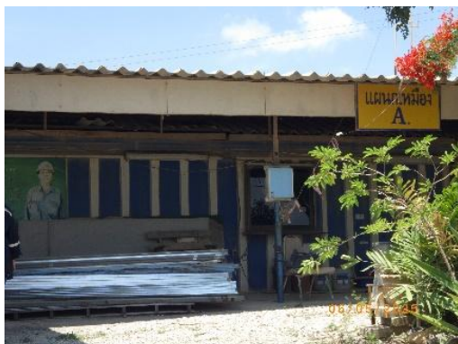
รูปที่ 2-27 สถานที่เก็บเครื่องมือและอุปกรณ์ บริเวณพื้นที่โครงการ

ของบริษัท ทีพีโอ โพลีน จำกัด (มหาชน) ระหว่างเดือนมกราคม-มิถุนายน พ.ศ. 2568