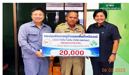
รูปที่ 2-33 การสนับสนุนกิจกรรมชุมชน