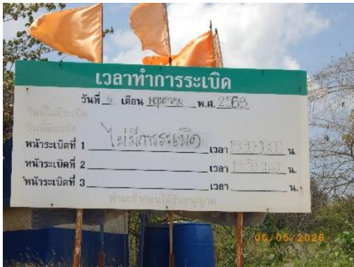
รูปที่ 2-24 ป้ายแจ้งวัน-เวลาระเบิด

โครงการเหมืองแร่หินอุตสาหกรรมชนิดหินปูน เพื่ออุตสาหกรรมปูนซีเมนต์ สำหรับแปลงคำขอประทานบัตรที่ 12/2556 ร่วมแผนผังโครงการทำเหมืองเดียวกัน กับคำขอประทานบัตรที่ 13/2556, คำขอประทานบัตรที่ 14/2556, คำขอประทานบัตรที่ 15/2556, คำขอประทานบัตรที่ 16/2556 และคำขอประทานบัตรที่ 17/2556 และประทานบัตรที่ 27340/14390 ประทานบัตรที่ 27341/14391 และประทานบัตรที่ 27348/14392 ของบริษัท ทีพีโอ โพลีน จำกัด (มหาชน) ระหว่างเดือนมกราคม-มิถุนายน พ.ศ. 2568