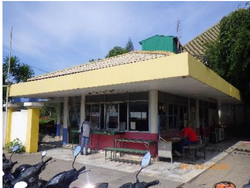
รูปที่ 2-1 อาคารติดต่อและรับเรื่องร้องทุกข์ของบริษัท

โครงการเหมืองแร่หินอุตสาหกรรมชนิดหินปูน เพื่ออุตสาหกรรมปูนซีเมนต์ สำหรับแปลงคำขอประทานบัตรที่ 12/2556 ร่วมแผนผังโครงการทำเหมืองเดียวกันกับคำขอประทานบัตรที่ 13/2556, คำขอประทานบัตรที่ 14/2556, คำขอประทานบัตรที่ 15/2556, คำขอประทานบัตรที่ 16/2556 และคำขอประทานบัตรที่ 17/2556 และประทานบัตรที่ 27340/14390 ประทานบัตรที่ 27341/14391 และประทานบัตรที่ 27348/14392 ของบริษัท ทีพีโอ โพลีน จำกัด (มหาชน) ระหว่างเดือนมกราคม-มิถุนายน พ.ศ. 2568