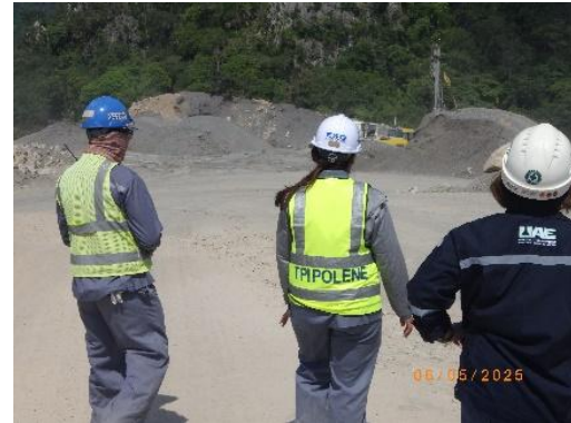
รูปที่ 2-2 การติดตามตรวจสอบตามมาตรการป้องกันและแก้ไขผลกระทบสิ่งแวดล้อม