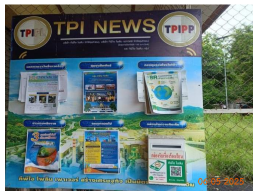
ศาลาประชาคม หมู่ 5 ต.มิตรภาพ