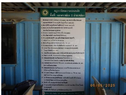
รูปที่ 2-29 ป้ายประกาศด้านความปลอดภัย และข่าวสารต่างๆ ในพื้นที่เหมือง