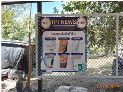
บ้านผู้ใหญ่ หมู่ 3 ต.ทับกวาง ที่ทำการผู้ใหญ่บ้าน ม.3

โครงการเหมืองแร่หินอุตสาหกรรมชนิดหินปูน เพื่ออุตสาหกรรมปูนซีเมนต์ สำหรับแปลงคำขอประทานบัตรที่ 12/2556 ร่วมแผนผังโครงการทำเหมืองเดียวกัน กับคำขอประทานบัตรที่ 13/2556, คำขอประทานบัตรที่ 14/2556, คำขอประทานบัตรที่ 15/2556, คำขอประทานบัตรที่ 16/2556 และคำขอประทานบัตรที่ 17/2556 และประทานบัตรที่ 27340/14390 ประทานบัตรที่ 27341/14391 และประทานบัตรที่ 27348/14392 ของบริษัท ทีพีโอ โพลีน จำกัด (มหาชน) ระหว่างเดือนมกราคม-มิถุนายน พ.ศ. 2568