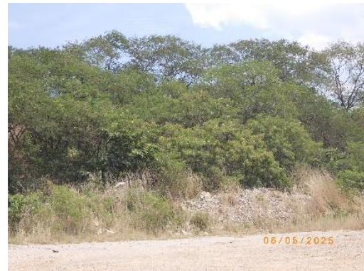
รูปที่ 2-13 การปลูกไม้ยืนต้นโตเร็วประจำถิ่นบริเวณขอบเขตพื้นที่โรงโม่บด และย่อยหิน