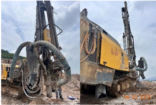
รูปที่ 2-7 เครื่องเจาะระเบิดที่มีระบบ Cyclone และถุงกรอง

โครงการเหมืองแร่หินอุตสาหกรรมชนิดหินปูน เพื่ออุตสาหกรรมปูนซีเมนต์ สำหรับแปลงคำขอประทานบัตรที่ 12/2556 ร่วมแผนผังโครงการทำเหมืองเดียวกันกับคำขอประทานบัตรที่ 13/2556, คำขอประทานบัตรที่ 14/2556, คำขอประทานบัตรที่ 15/2556, คำขอประทานบัตรที่ 16/2556 และคำขอประทานบัตรที่ 17/2556 และประทานบัตรที่ 27340/14390 ประทานบัตรที่ 27341/14391 และประทานบัตรที่ 27348/14392 ของบริษัท ทีพีโอ โพลีน จำกัด (มหาชน) ระหว่างเดือนมกราคม-มิถุนายน พ.ศ. 2568