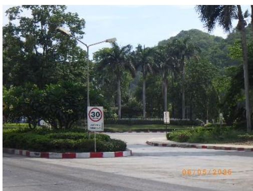
รูปที่ 2-16 ป้ายกำหนดความเร็วของยานพาหนะในพื้นที่โครงการ ไม่เกิน 30 กม./ชม.