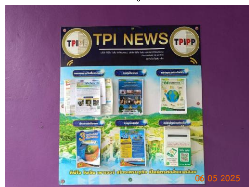
ศาลาประชาคม หมู่ 7 ต.มิตรภาพ