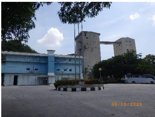
รูปที่ 2-20 พื้นที่สำหรับจอดรถบรรทุก รับ-ส่งวัตถุดิบในการผลิตซีเมนต์