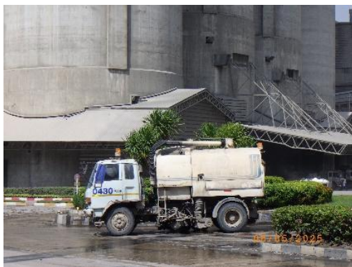
รูปที่ 2-14 รถดูดฝุ่นทำความสะอาดฝุ่นบริเวณลานหน้าประตู 3